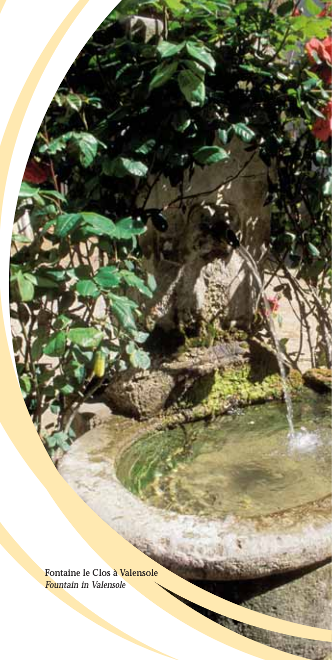
Fontaine le Clos à Valensole Fountain in Valensole