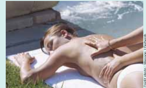
Massage aux Thermes de Gréoux-les-Bains Massage in the thermal baths

Au bord des lacs d'Esparron et de Sainte-Croix, appelés "les lacs de soleil", pour qui sait marcher ou ramer, des criques solitaires offrent encore des havres de tranquillité. Simplement plonger son regard dans