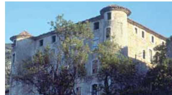
Château de la Palud-sur-Verdon Castle in la Palud-sur-Verdon

A l'est, le Roc de Castellane, la haie d'honneur de calcaire blanc des Cadières de Brandis, au nord, le chaos de blocs de grès d'Annot, la cité médiévale d'Entrevaux préparent de leur côté l'entrée en scène du Grand Canyon. Le Parc Naturel Régional du Verdon et les habitants s'emploient à respecter ce patrimoine intact et cette nature extrême ainsi qu'à le faire mieux connaître aux visiteurs.