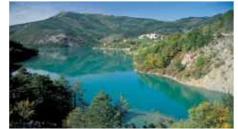
Lac de Castillon Castillon lake

Quelle que soit la saison, impossible de ne pas être bluffé par ce colossal défilé, le plus vertigineux d'Europe. Et quand le Verdon s'assagit dans les Basses-Gorges, l'ambiance est toute aussi prenante mais plus intime et plus secrète.