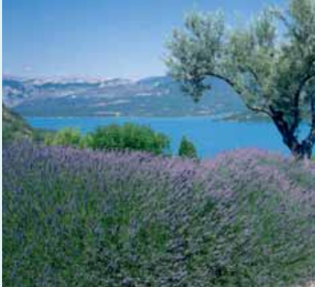
Lac de Sainte-Croix du Verdon Sainte-Croix du Verdon lake