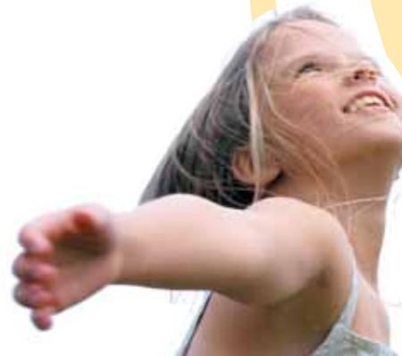
Notre Dame de Lure