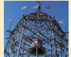
Campanile Bell tower

Toute cette richesse naturelle et humaine est à découvrir dans la Réserve Naturelle Géologique de Haute-Provence, au Centre d'Astronomie de Saint-Michel L'Observatoire qui apprend à lire ce ciel si pur, au Conservatoire Ethnologique de Salagon qui raconte le passionnant passé des hommes de ce pays. Autant de «vraies richesses» à partager.