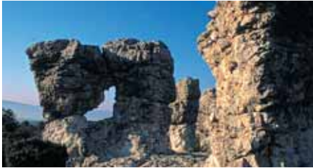
Rocher des Mourres

To the south of the Alpes de Haute-Provence, in amidst the hills covered with young oaks, the lavender fields and the deep-green olive trees, meanders the Durance river.